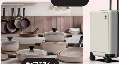
ライフスタイル 雑貨