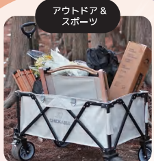
アウトドア & スポーツ

中国・浙江省をはじめ 台湾とアジアの国・地域から 約1,000種類の商品が出展！