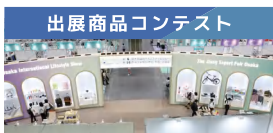
出展商品コンテスト